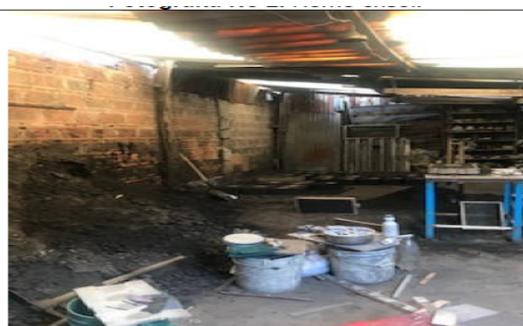
Fotografía No 4. Vista general de área de producción.