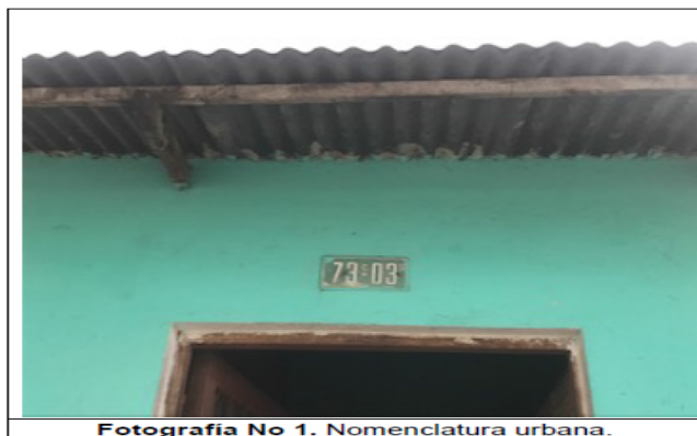
Fotografía No 1. Nomenclatura urbana.