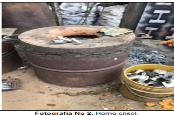
Fotografía No 2. Horno crisol.