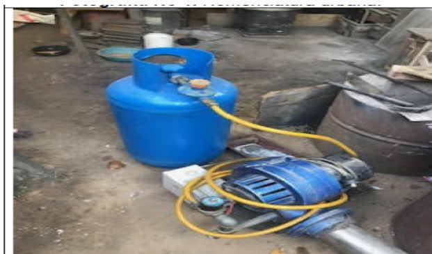
Fotografía No 3. Cilindro de gas propano y quemador.